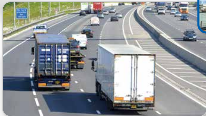
高度道路交通システム (ITS)

ハードウェアおよびソフトウェアの設計を配慮し、複数データ転送プロトコル、ストレージ追加可能、電源入力力の柔軟な互換性、スマートモーター管理機能、VecowのSPC-2000シリーズ ファンレス超小型産業用PCは、コスト面ではお客様に多くの価値を提供し、簡単に各種のIOT(モノのインターネット)ソリューションの構築ができます。